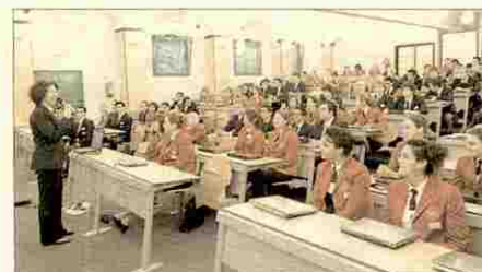
Aula y alumnos de Les Roches Marbella.

El centro ofrece desde hace dos años el posgrado en Gestión de Campos de Golf, el primero de estas características que se desarrolla en España, orientado a titulados universitarios y profesionales con experiencia en el sector que deseen una