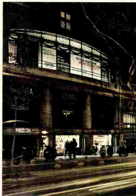
Escuela Superior de Diseño en Barcelona.

profesionales y ejecutivos de empresas de reconocido prestigio. Además, brinda la posibilidad de realizar prácticas en empresas relacionadas.