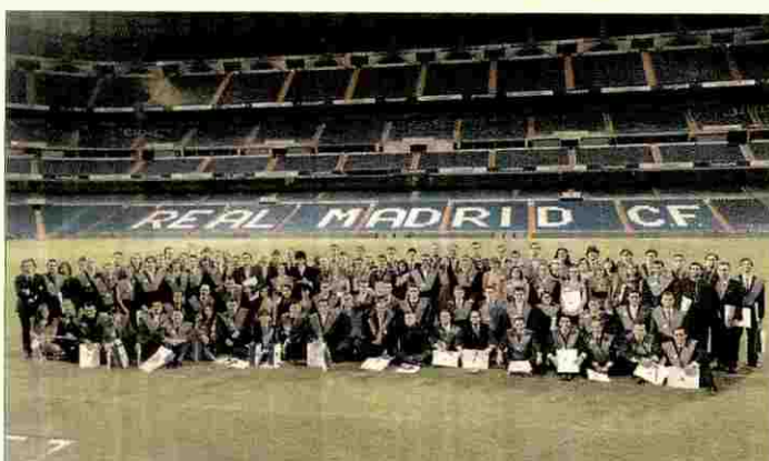
Acto de inauguración de la Escuela Real Madrid en el estadio Santiago Bernabéu.