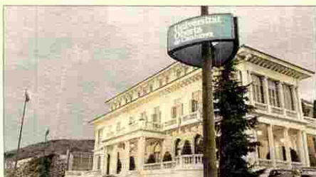
Sede de la Universitat Oberta de Catalunya.